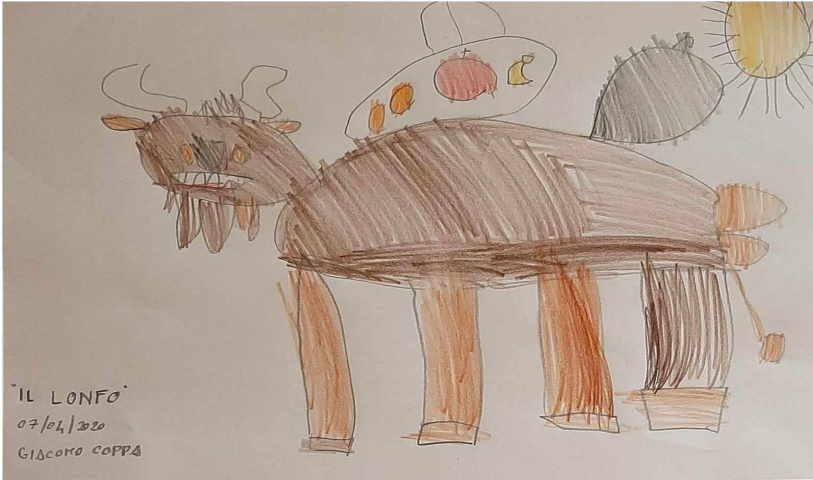
"IL LONFO" 07/04/2020 GIACOMO COPPA